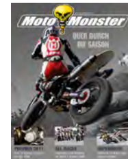
Hochformat: 768px x 1004px