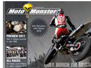
Querformat: 1024px x 748px

Die Größenangaben sind bei allen Werbemöglichkeiten gleich, es wird je ein Quer- und ein Hochformat benötigt. Bei Videos ist 16:9 oder 4:3 möglich.